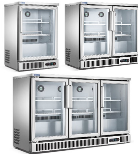
MODELOS SG160 | SG250 | SG380