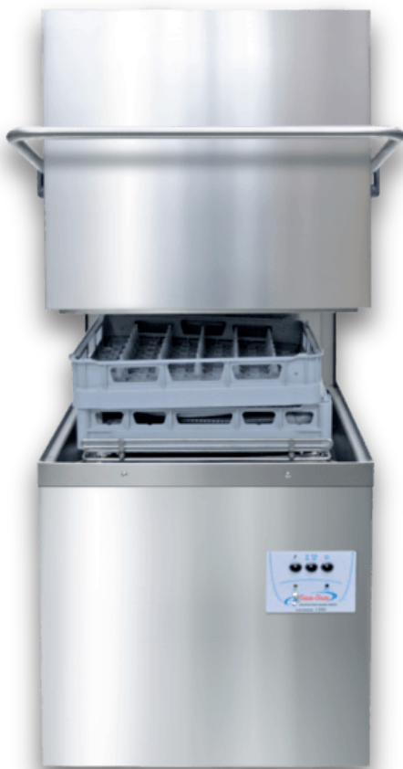
mod. LAVAMAX 1000